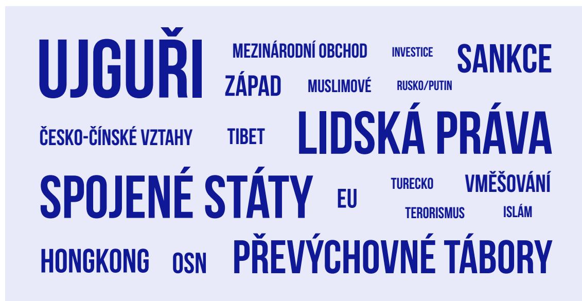
OBRÁZEK 4: ZOBRAZENÍ KLÍČOVÝCH TÉMAT SPOJENÝCH S PROBLEMATIKOU SIN-ŤIANGU V ANALYZOVANÝCH ALTERNATIVNÍCH ČESKÝCH MÉDIÍCH (2019–6/2021)

Zajímavé je, že v listopadu 2019 Parlamentní listy zveřejnily výzvu českých poslanců kritizující Čínu za porušování lidských práv, mučení a nelegální prodej lidských orgánů. Přímo se v něm uvádí: „Jsem přesvědčen, že máme v rukou diplomatické nástroje, jak vyjádřit svůj zásadní nesouhlas s tím, co se v oblasti lidských práv v Číně děje.[...]. Nesmíme mlčet k potírání základních lidských práv, které se