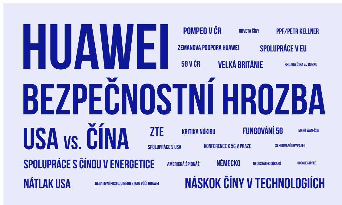
OBRÁZEK 1: REPREZENTACE KLÍČOVÝCH TÉMAT SPOJENÝCH S TÉMATEM 5G SÍTÍ V SOUVISLOSTI S ČÍNOU V ANALYZOVANÝCH ČESKÝCH ALTERNATIVNÍCH MÉDIÍCH (2019–6/2021)

Výsledky předchozí analýzy projektu MapInfluenCE zaměřené na téma 5G sítí v mainstreamových médiích poskytly týmu možnost zajímavého srovnání mediálního pokrytí daného tématu. 23 Alternativní média se v pokrytí klíčových témat příliš nelišila od mainstreamových médií. Diskuzi o sítích páté generace dominovalo téma spojené s otázkou kolem čínské společnosti Huawei. Další čínská společnost ZTE byla zmíněna jen okrajově. Diskuze se točila zejména kolem bezpečnostních rizik a varování vydaných v různých zemích, se zvláštní pozorností věnovanou Spojenému království 24 a Německu a tzv. Five Eyes (zpravodajské alianci Austrálie, Kanady, Nového Zélandu, Velké Británie a USA). Stejně jako v mainstreamových médiích se i články publikované v alternativních médiích zaměřovaly na strategie pro budování 5G sítí a spolupráci s partnery, zejména USA a EU. 25 Otázka 5G byla významným bodem diskuze během návštěvy Mikea Pompea v České republice 26 a návštěvy Andreje Babiše v USA. 27