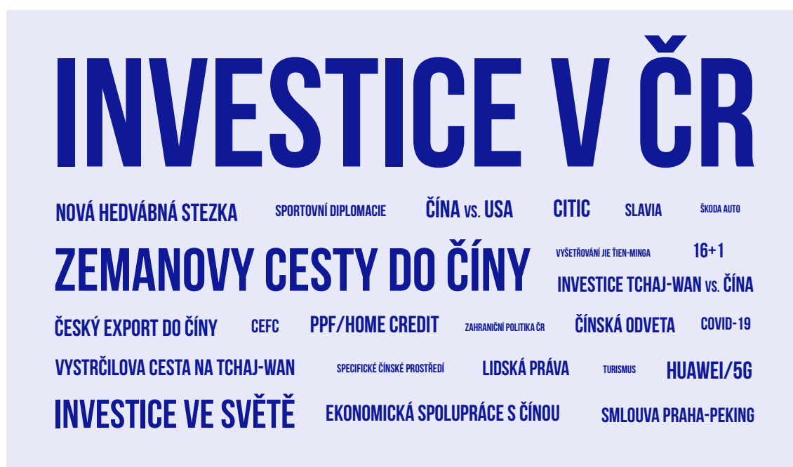
OBRÁZEK 2: REPREZENTACE KLÍČOVÝCH TÉMAT SPOJENÝCH S ČÍNSKÝMI INVESTICEMI V ANALYZOVANÝCH ČESKÝCH ALTERNATIVNÍCH MÉDIÍCH (2019–6/2021)

Investice (nebo jejich nedostatek) 69 byly často zmiňovány na pozadí česko-čínských vztahů, např. ve zprávách o návštěvách prezidenta Zemana v Číně, zejména v debatě o jeho možné návštěvě summitu platformy spolupráce zemí střední a východní Evropy s Čínou (tzv. “16+1”) na jaře 2020. 70 S Milošem Zemanem se pojila i další zásadní témata, například snahy o sportovní diplomacii a doprovod slavných českých sportovců Jaromíra Jágra a Pavla Nedvěda při jeho cestě do Číny. 71